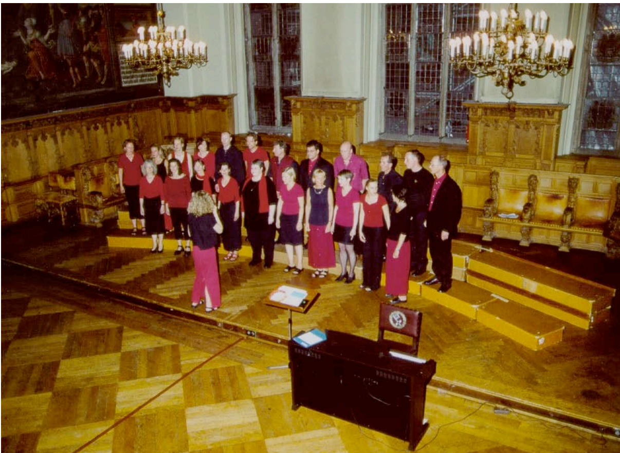
2002: Auftritt in der Oberen Rathaushalle in Bremen

Enfin, l'été, nous avons collecté plusieurs centaines d'euros lors d'un concert spontané dans la zone piétonne de Brême donné au profit des sinistrés des crues de la chorale de Dresde. En outre nous avons été invités à chanter lors du concert d'anniversaire de la chorale germano-polonaise de Brême.