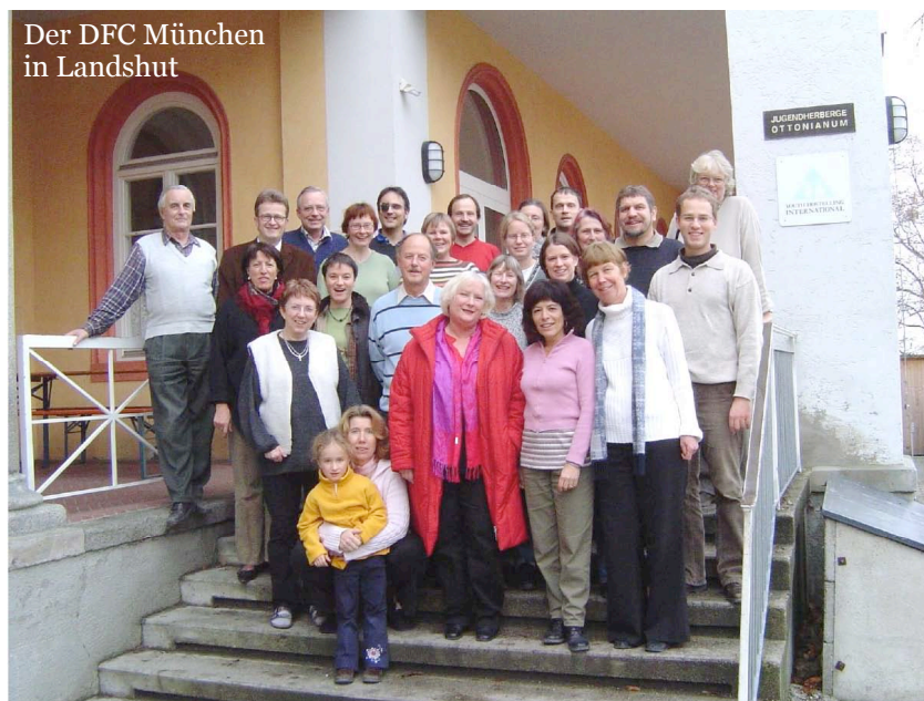
Der DFC München in Landshut

Les demandes se font par mail, par contacts avec des institutions françaises, des contacts privés..entre choristes mais ce sont surtout des dames ... alors que nous recherchons des messieurs.