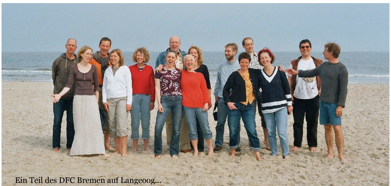
Ein Teil des DFC Bremen auf Langeoog...

Pour notre traditionnel concert d'Automne pour nos amis de Brême, nous avons invité cette fois-ci la chorale „Hey now!“ de Bremerhaven. Tout au long de l'année se présentèrent des occasions de petites apparitions comme celle traditionnelle dans le cadre de la Fête de la Musique à l'Institut Français. Il nous faut tout particulièrement souligner l'invitation de la Société Franco-Allemande de Brême pour chanter lors de la « soirée de bienvenue » donnée en l'honneur de l'entrée dans l'Union Européenne des nouveaux pays : la présentation de chaque pays de l'Union par des stands informatifs et des spécialités culinaire fut encadrée par un programme culturel donné entre autre par nos amis de la chorale germano-polonaise et nous-même.