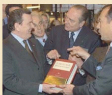
Staatspräsident Jacques Chirac und Bundeskanzler Gerhard Schröder besuchen die Pariser Buchmesse (Porte de Versailles, Paris). 15.03.2001 Salon du livre: visite du Président de la République, M. Jacques Chirac, et du Chancelier, M. Gerhard Schroeder (Porte de Versailles, Paris). 15.03.2001