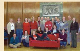
Der Deutsch-Französische Chor Bremen im Institut français La chorale franco-allemande de Brême à l'Institut français