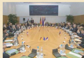
78. deutsch-französische Konsultationen: Plenarsitzung (Nantes, Cité des Congrès). 23.11.2001 78ème consultation franco-allemande : séance plénière (Nantes, Cité des Congrès) 23.11.2001