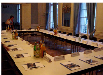
le Salon bleu de l'Institut